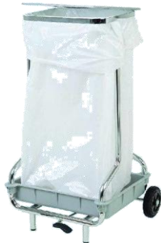
MODELO 360 L 57 x An 55 x Al 96