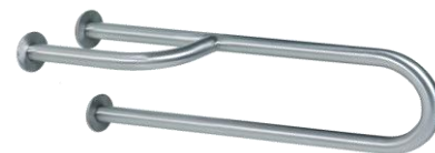
BARRA PARED FIJA DCHA. O IZQ.