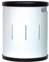
MODELO 310 32 x 20 Ø