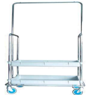
MODELO 1250 (carro perchero) L 100 x An 73 x Al 109