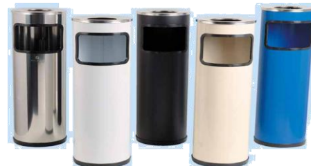
MODELO 710 66 x 21