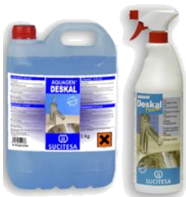
AQUAGEN® DESKAL Limpiador antical