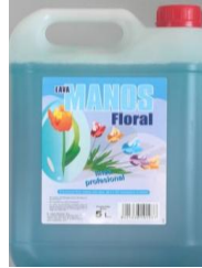
Gel de manos floral