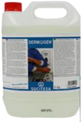
DERMOGEN® Gel antiséptico piel intacta