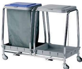
MODELO 580 L 57 x An 55 x Al 96