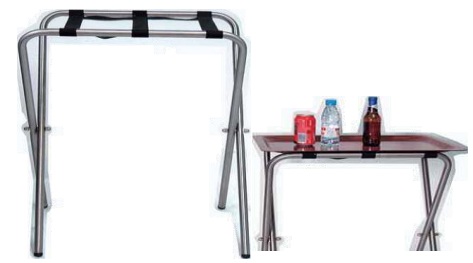
MODELO 620 L 59 x An 40 x Al 69