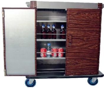
MODELO 1260 (reposicion bebidas) L 92 x An 58 x Al 115