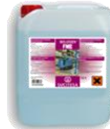
SOLUGEN® FME Desengras. mineral