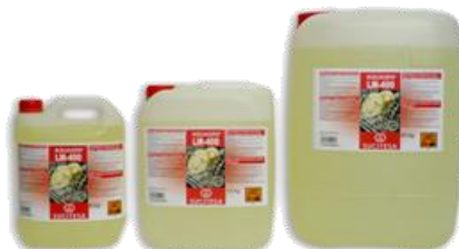
AQUAGEN® LM-400 Detergente máquinas aguas semi-duras