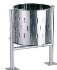
MODELO 540/G 75 x 48 Ø