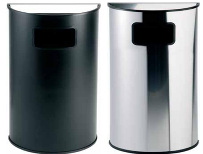
MODELO 2000 - 2001 46 x 24 x 86