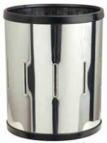
MODELO 310 G 32 x 30 Ø