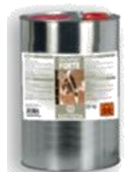
DECAPINT FORTE Gel antigraffiti