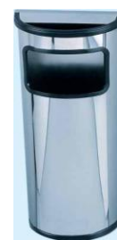
MODELO 1200 55 x 40 x 15