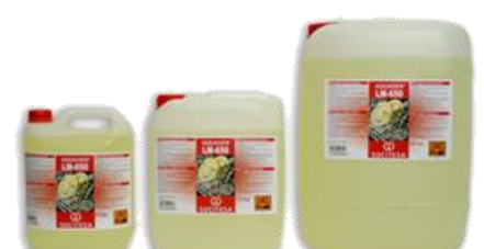
AQUAGEN® LM-650 Lavavajillas máquina. Aguas duras