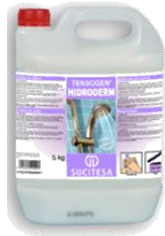
TENSOGEN® HIDRODERM Crema de jabón ducha