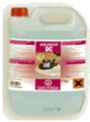
AQUAGEN® DC Decapante alcalino