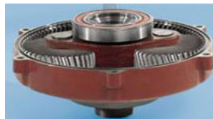
engranajes de acero