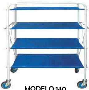
MODELO 140 L 110 x An 80 x Al 46