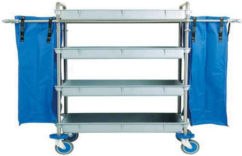
MODELO 10 L 147 x An 56 x Al 128