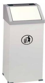
MODELO 340 55 x 40 x 15