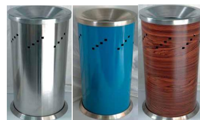
MODELO 690 55 x 26 Ø