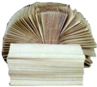
TOALLAS ZIG - ZAG