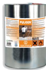
PULIGEN® MULTIUSOS Captador de polvo