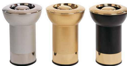
MODELO 250 51 x 31