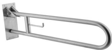
BARRA ABATIBLE DCHA./IZQ.