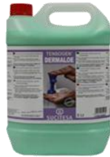
TENSOGEN® DERMALOE Gel lavamanos granulado