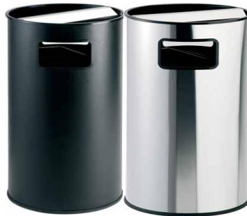
MODELO 2100 - 2101 86 x 45 Ø