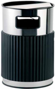
MODELO 2100/F 86 x 45 Ø