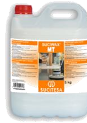
SUCIWAX® MT Restaurador suelos encerados