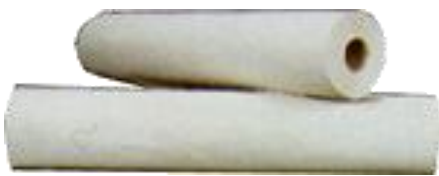
ROLLO PAPEL CAMILLA