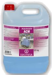
AQUAGEN® ACM Deter. acido fregadoras