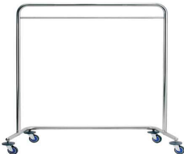
MODELO 850 (carro perchero) L 160 x An 55 x Al 170