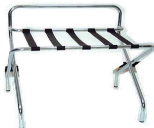
MODELO 610 L 73 x An 61 x Al 69