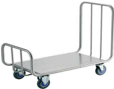
MODELO 470 L 116 x An 60 x Al 105