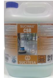
SUCIWAX® CSB Cristalizador sellador