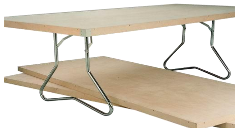
Mesas de banquetes plegables L 205 X An 90 X Al 72