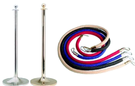
MODELO 280 y cordones 85 cm. de alto por 40 Ø y cordones de 1 mt o 1,5 mt