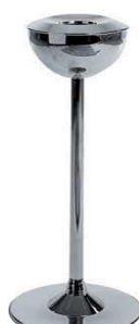
MODELO 270 57 x 24