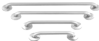
BARRA PARED RECTA DCHA./IZQ.