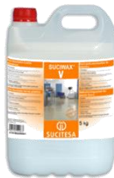
SUCIWAX® V Abrill. suelos plásticos