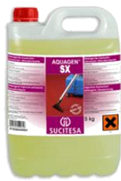
AQUAGEN® SX Deterg. inyecc.-extracc.