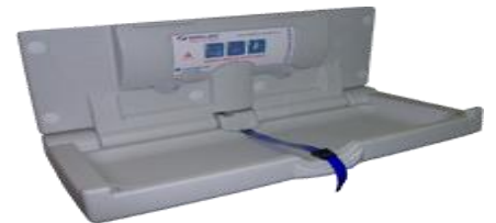
CAMBIADOR DE BEBE HORIZONTAL