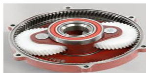
engranajes de nylon