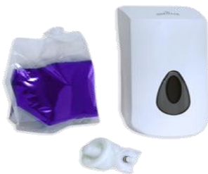
DOSIFICADOR ESPUMA LAVAMANOS

Dispensador para desinfectante de asientos de WC