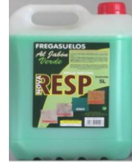
Fregasuelos jabón verde