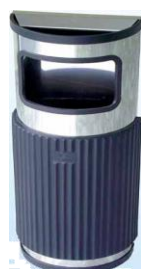
MODELO 1200/F 64 x 25 x 15