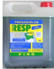
Fregasuelos pino neutro