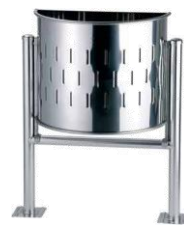
MODELO 540/SG 75 x 48 Ø