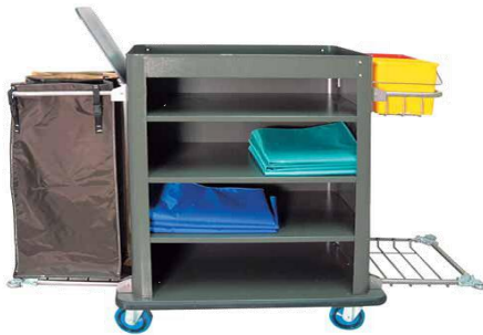
MODELO 1800 L 165 x An 58 x Al 115