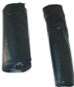
BOLSAS DE BASURA DE COMUNIDAD Y PAPELERA