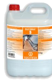
SUCIWAX® S Abrill. suelos cerámicos