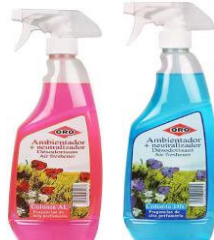
Ambientador colonia AL-DN