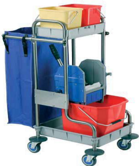
MODELO 570 L 82 x An 48 x Al 109