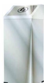
MODELO 340/80 95 x 32 x 25