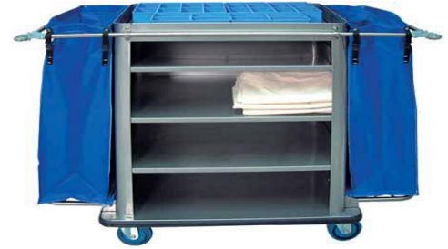
MODELO 1500 L 136 x An 64 x Al 115