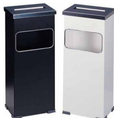
MODELO 320 22 x 16 x 66