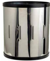
MODELO 310 GH 34 x 23 Ø