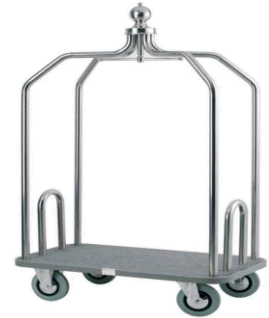
MODELO 900 L 116 x An 62 x Al 190