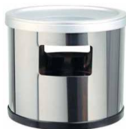
MODELO 260 64 x 18 x 18