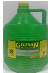
Lejía con detergente