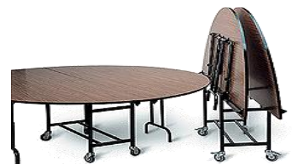
Mesas de banquetes plegables redondas Diámetro: 1800/2000