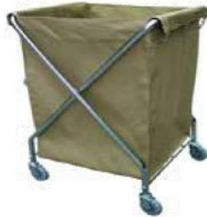
MODELO 8157 L 65 x An 60 x Al 98