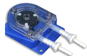
BOMBA DE 16 L/H