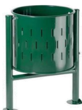
MODELO 540 78 x 37/47 Ø