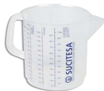
JARRA LAVANDERIA 1000