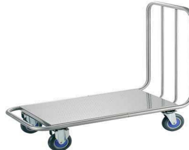
MODELO 470/S L 110 x An 60 x Al 105