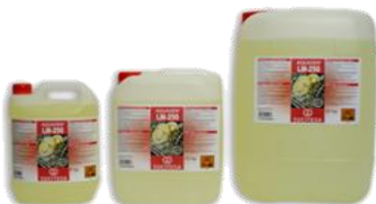
AQUAGEN® LM-250 Lavavajillas máquina. Aguas blandas