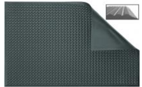
POLIURETANO O NITRILO