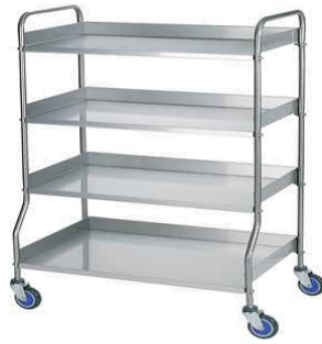
MODELO 100 L 88 x An 55 x Al 127