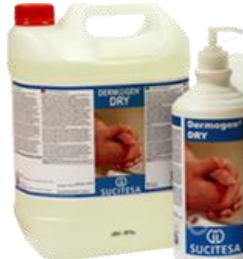
DERMOGEN® DRY Loción antiséptica