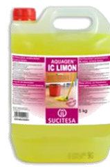
AQUAGEN® IC LIMON Brillasueros ambientador