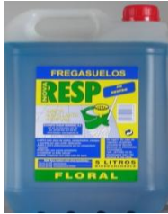
Fregasuelos floral neutro