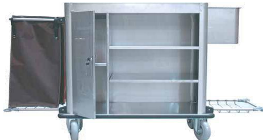
MODELO 1900 L 185 x An 58 x Al 125