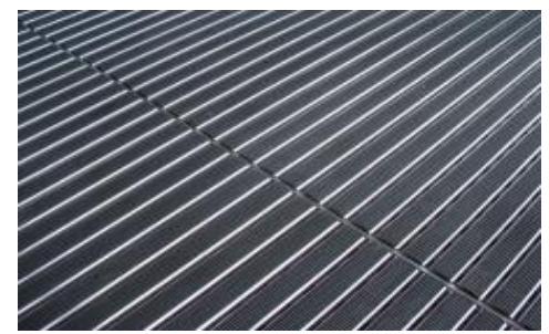
DE ENTRADA (ALUMINIO)