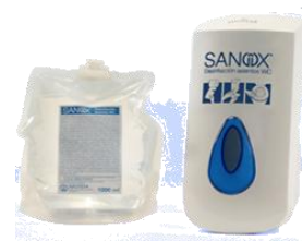
SANIX® Desinf. asientos WC