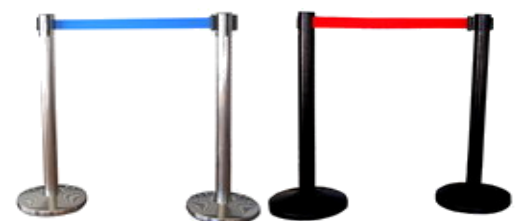
MODELO 281 inox y negro 91 cm. de alto x 32 Ø + cinta 2 mt