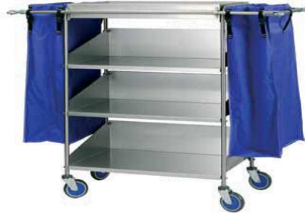
MODELO 70 L 145 x An 66 x Al 130