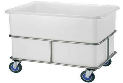
MODELO 1300(250 lt) y 1300(440 lt) L 90/111 x An 64/78 x Al 83/88