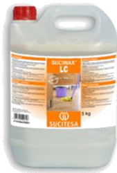
SUCIWAX® LC Lavicera