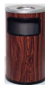
MODELO 660 56 x 23,5 Ø