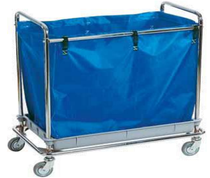
MODELO 110 L 95 x An 56 x Al 104