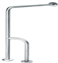
BARRA PARED-SUELO DCHA. O IZQ.