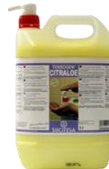
TENSOGEN® CITRALOE Gel lavam. granulado fuerte