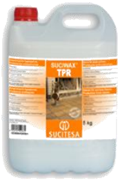
SUCIWAX® TPR Tapaporos -antimanchas