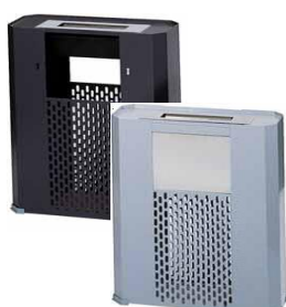
MODELO 290 55 x 40 x 15