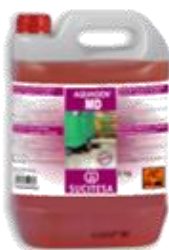
AQUAGEN® MD Desengras. vegetal