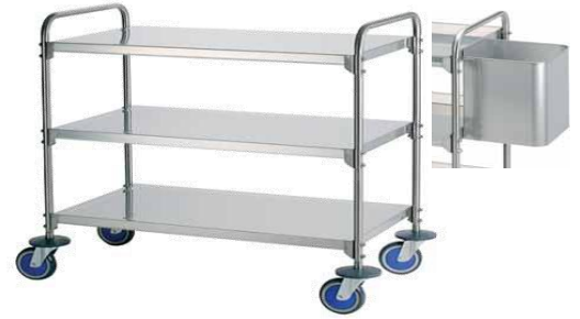
MODELO 155/1551 L 95 x An 50 x Al 96