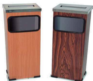
MODELO 670 23 x 17 x 63,5