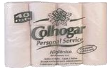
ROLLO HIG. DOMESTICO