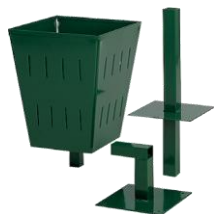
MODELO 180 50 x 30 x 30