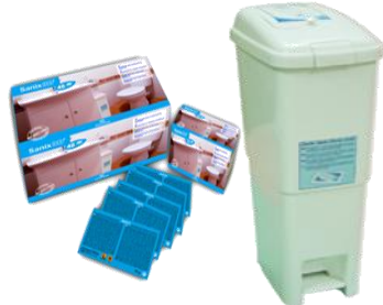
SANIX-3D®+SANI-BOX Bactericida y compresero