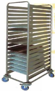
MODELO 650 L 78 x An 56 x Al 195