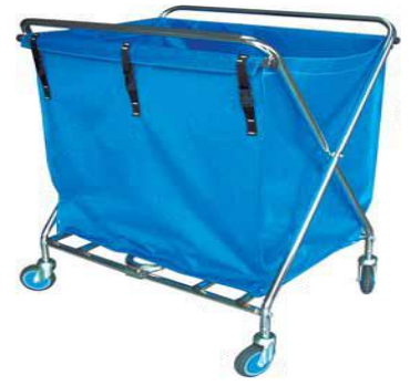
MODELO 230 L 76 x An 56 x Al 92