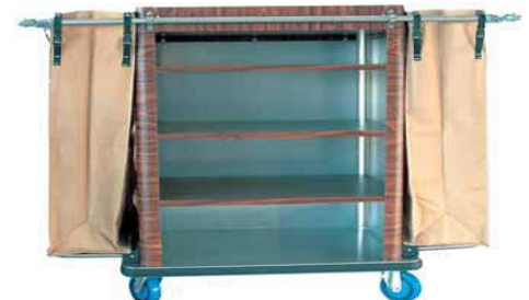
MODELO 1400 L 136 x An 64 x Al 115