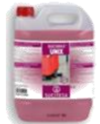
SUCIWAX® UNIX Fregasueros autobrillante