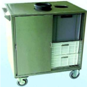
MODELO 1250 (desbarazar) L 100 x An 73 x Al 109