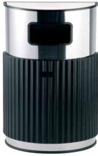
MODELO 2001/F 46 x 24 x 86