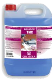
AQUAGEN® TMC Espuma seca moquetas