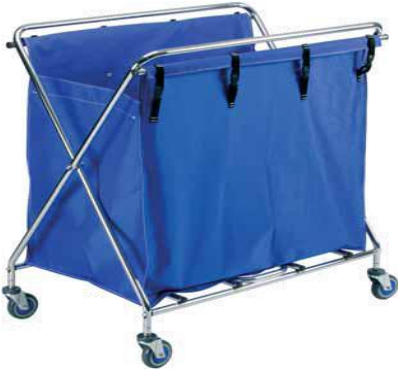
MODELO 220 L 99 x An 63 x Al 109