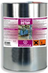
SOLUGEN® DETAR Decap. Emulsionable