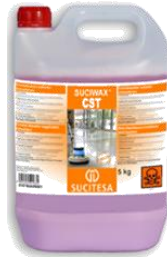
SUCIWAX® CST Cristalizador sellador