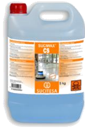
SUCIWAX® CS Cristalizador base