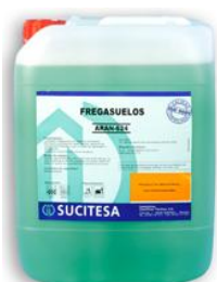
AQUAGEN® ARAN-624 Fregas. neutro fregadora