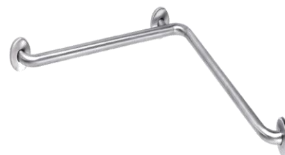
BARRA BAÑO DCHA./IZQ.