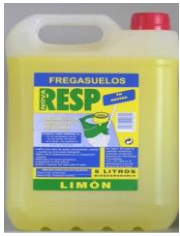
Fregasuelos limón neutro