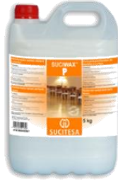
SUCIWAX® P Abrill. suelos madera corcho