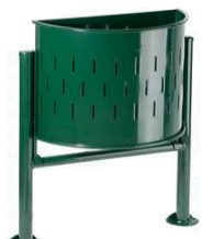
MODELO 540/5 47/62 x 25 x 87