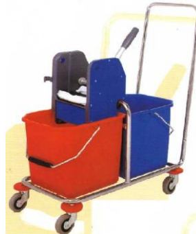
MODELO 500 L 94 x An 36 x Al 72