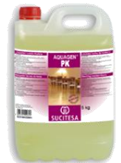
AQUAGEN® PK Limpiador suelos madera