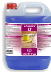
AQUAGEN® LT Detergente amoniacal