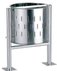
MODELO 540/GB 83 x 56 Ø