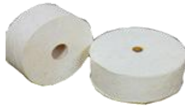
ROLLO HIG. IND.