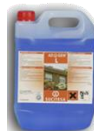
ADIGEN® L Limpi. anticalcáreo