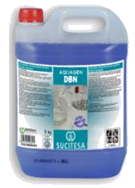
AQUAGEN® DBN Deter. bactericida residual