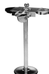
MODELO 301 18 x 10 x 6