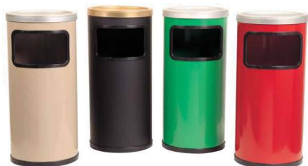
MODELO 210 55 x 25 Ø