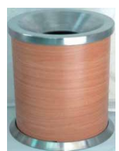
MODELO 310 33 x 26 Ø