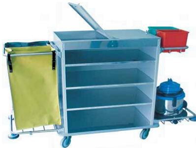
MODELO 1600 L 177 x An 59 x Al 120