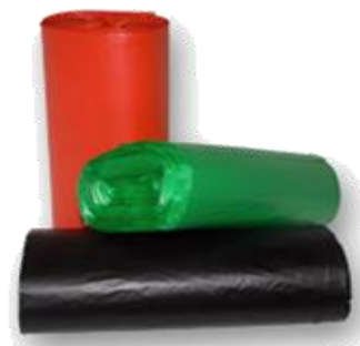
BOLSAS BASURAS DE COLORES