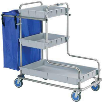
MODELO 50 L 122 x An 56 x Al 106