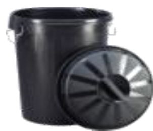
50 y 100 LTS.