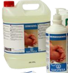
DERMOGENOL® Gel hidroalcohólico