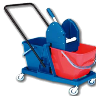
MODELO UN CUBO Y DOBLE