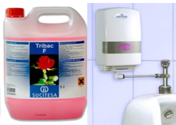
TRIBAC-F FLORAL+SANIMATIC CM Producto bacteri. floral