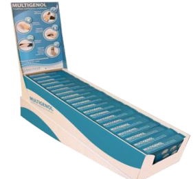
MULTIGENOL® Toallitas sanitarias multiuso