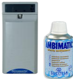
DOSIFICADOR AMBIENTAL ELECTRONICO