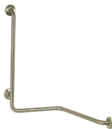
BARRA BAÑO 3 AGUAS DCHA. O IZQ.