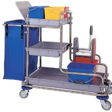
MODELO 480 L 122 x An 56 x Al 104