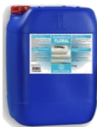
SUAVIGEN® Q FLORAL