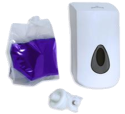
TENSOGEN® FOAM Espuma lavamanos