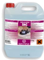
AQUAGEN® DAC Decapante ácido pavimentos