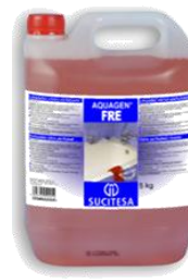
AQUAGEN® FRE Limpiador cítrico perfumado