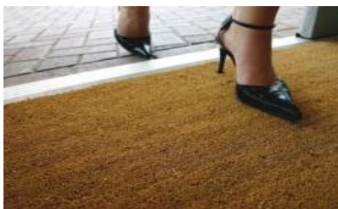
DE ENTRADA (COCO NATURAL)