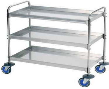
MODELO 150 L 103 x An 61 x Al 96