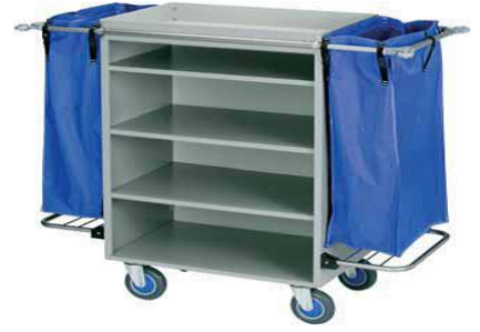
MODELO 1100 L 147 x An 67 x Al 127