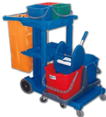
MODELO RUBBY COMPLETO