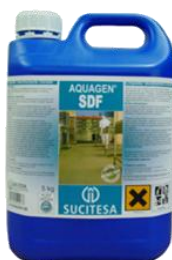
AQUAGEN® SDF Limpi. desinf. Clorado