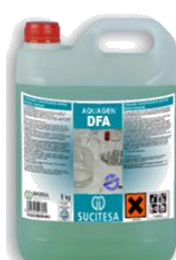
AQUAGEN® DFA Deter. Desinf. alcalino residual