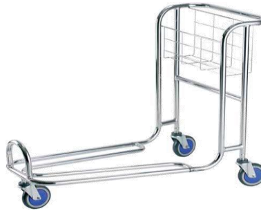
MODELO 240 L 91 x An 55 x Al 185