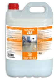
SUCIWAX® VAR Abrill. suelos plásticos.