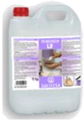
TENSOGEN® LB Gel de manos nacarado