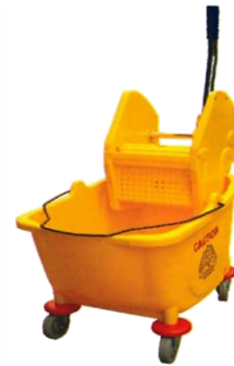
MODELO GRAND JET